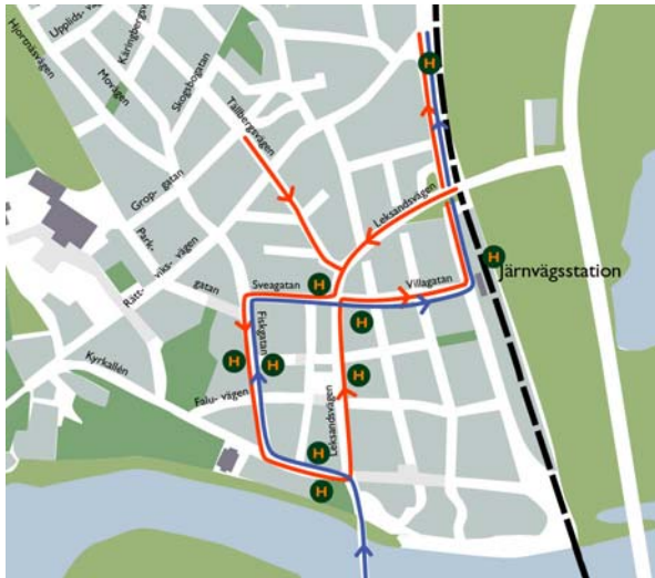
Alternativ A Inkommande bussar exkl linje 258

Alternativ A innebär dubbelriktad busstrafik på Fiskgatan, alternativ B innebär enkelriktad södergående busstrafik på Fiskagatan. I båda alternativen utgör gamla brandstationen centrumhållplats. Samtliga bussar angör järnvägsstationen där också tidreglering sker. I utredningen redovisas följande linjenät för alternativ A respektive B :