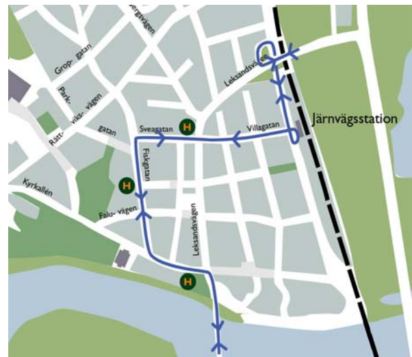
Alternativ A och B Linjesträckning för buss 258 I alternativ B får bussen från Borlänge först köra Leksandsvägen, där av-/påstigning kan ske, och sedan svänga till vänster in på Sveagatan