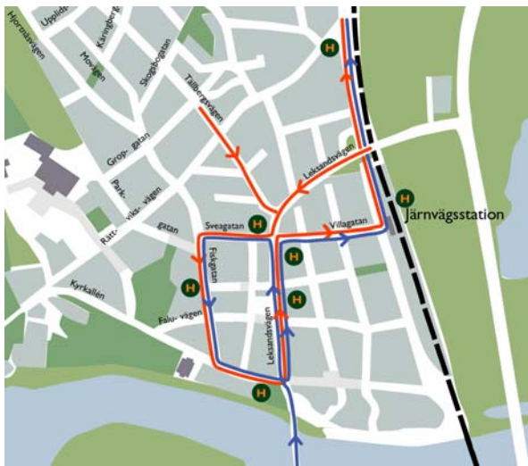
Alternativ B Inkommande bussar exkl linje 258 (lika i båda alternativen)