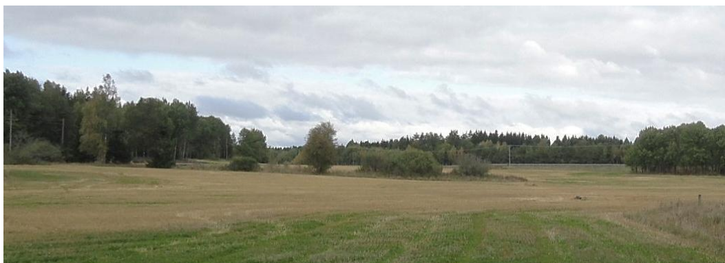
Figur 2. Väster om Kockbackavägen ligger en åkerholme, vy mot nordväst.

Utredningsområdet präglas av ett mosaikartat jordbrukslandskap omgivet av skog. Skogsområdena domineras till viss del av produktionsskog, men har även värdefulla miljöer i form av fuktiga partier och områden med äldre träd.